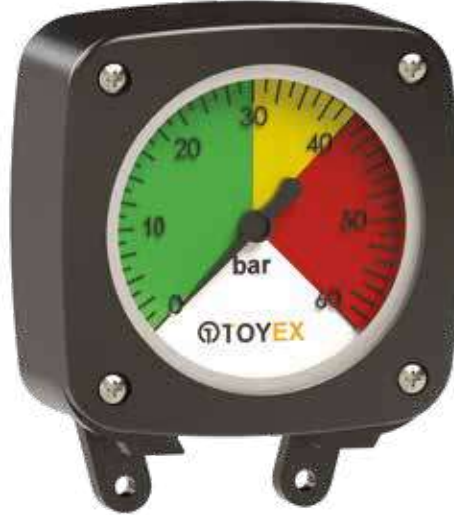
Standart Standard / Estándar