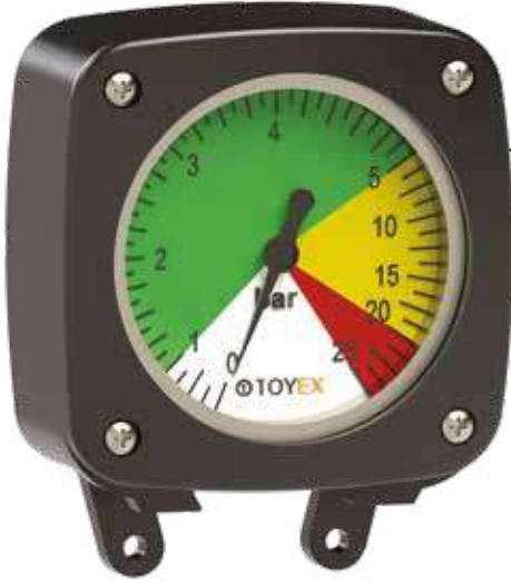
İsometrik Isometric / Isométrico